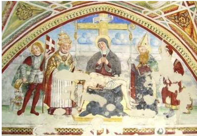
La pietà con i santi titolari della chiesa.

pure decorati con segni geometrici, si possono contemplare i 4 evangelisti con i loro classici simboli e l'immane libro. La gamma dei colori, qui (forse per l'idea di celestialità che viene dalla volta di un intradosso) ha una tonalità più tenue a confronto con la vivacità delle figure (più vicine all'osservatore) stazionanti sulle pareti dell'abside. Prima di voltare le spalle a questa galleria d' arte, notiamo in basso tutto'ingiro, uno zoccolo parietale a strisce gialle e rosse, che ben s'accosta agli affreschi ed al tono caldo del nuovo pavimento in cotto; non risulta a fresco, bensì con colori a caseina, e pertanto è un'aggiunta posteriore.