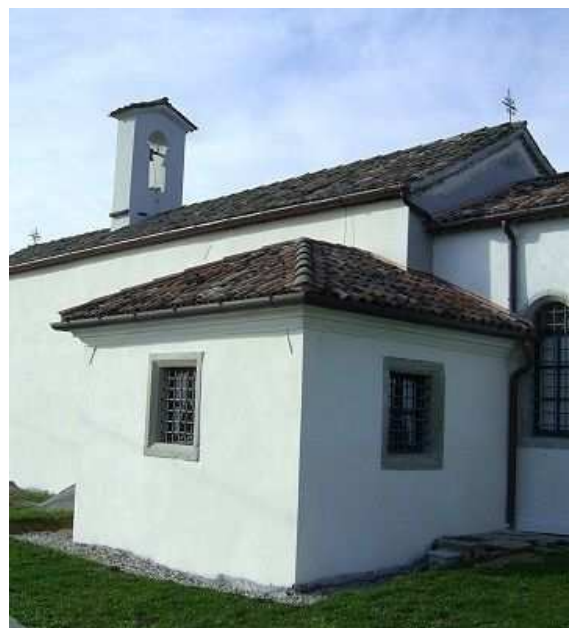
La sacrestia sul lato sud della chiesetta