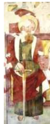
Particolari del ciclo di affreschi