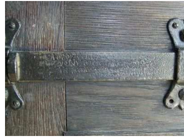
In rilievo si riesce ancora a leggere la «maledizione» contro i ladri.