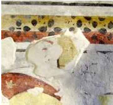
Lacerto di affresco antico affiorato a lato del pilastro dell'arco trionfale.

col restauro artistico in presbiterio (uno a sinistra presso il pilastro dell'arco trionfale ed un altro nella parete di fondo, a destra, sopra la figura del penultimo apostolo, sotto un intonaco di spessore da uno a due cm.) e le tracce nel muro esterno in alto, verso la strada, risultate evidenti dopo lo scrostamento dell'intonaco, ove poggiavano tre sostegni, presumibilmente travi, di un'appendice di copertura per un vano appartenente solo alla chiesa precedente e di cui si parlerà qui di seguito. Di altre strutture, se si eccettua una porta laterale, non ci è dato di sapere.