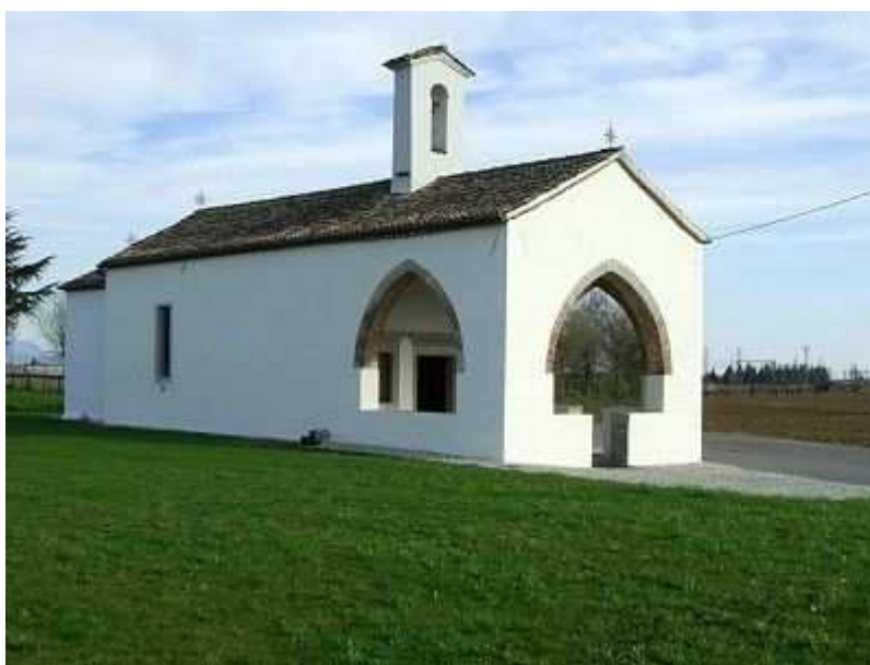
La chiesetta vista da settentrione

Fra le varie chiese votive (una decina) racchiuse nelle dimensioni geografiche di Tricesimo una particolarmente cara al cuore dei tricesimani è fuori dubbio la chiesa intitolata a S. Pelagio , situata ad est di Adornano , al limite del territorio su cui si estendono sia la pieve che il comune di Tricesimo . La chiesetta sorge in aperta campagna; l’atto della consacrazione, avvenuta in data imprecisata tra il 1547 e il 1557, così la descrive: « ecclesiam Sancti Pelagij campestrum de Villa Adornani Aquilejensis Dioecesis » (1), mentre nel secolo seguente, quando i documenti ufficiali vengono stilati «in lingua», si trovano frasi del genere: « Nel territorio della nostra Villa s’attrova in luogo campestre una Chiesa sotto l’invocatione di Santo Pellagio » (2). E fra le trenta Ville (cioè paesi a dimensione rurale) richiamate in un registro della Cancelleria patriarcale nell’anno 1500 per la visita che doveva compiere l’arcidiacono aquileiese nella nostra pieve (3), non risulta inclusa alcuna Villa di S. Pelagio; la chiesa in