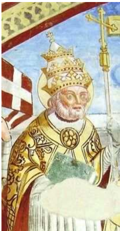
San Pelagio come viene rappresentato da G. P. Thanner.

cardinale, la sua elezione pittorica con tanto di tiara sulla testa del Santo non comporta effetti storici retroattivi.