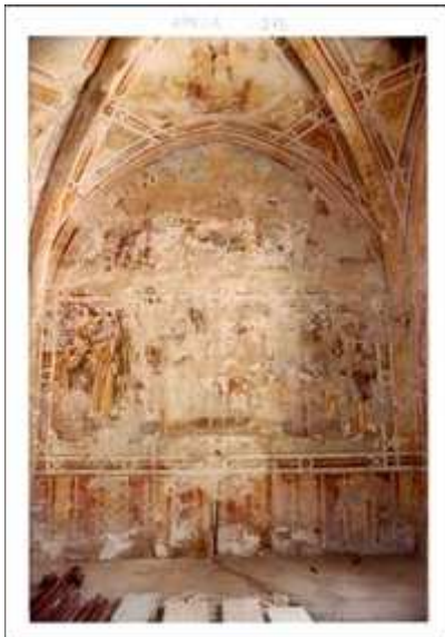
Prima del restauro