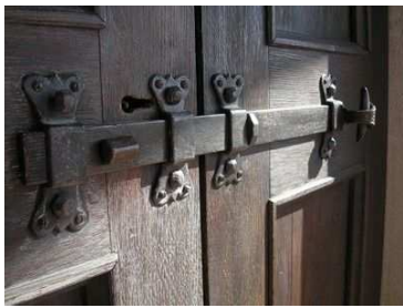
Il catenaccio della porta di ingresso all'aula.

Su ambedue le porte (navata e sacristia) sono state riapplicate le montature in ferro battuto originali : cardini, catenacci e maniglie. Proprio sul catenaccio della porta d'ingresso , qualche fabbro in tempi antichi incise una significativa frase: «Ladro guarda S. Pelagio: (se) tu vorà robà sarà subito inpicà» , che non fermò i ladri (forse perché l'oscurità non permise loro la lettura) nella notte del 13 marzo 1973 quando sfasciarono la porta e trafugarono le tre statue dei titolari, ritrovate dalla Guardia di Finanza dopo un anno a Palmanova e restituite alla nostra pieve.