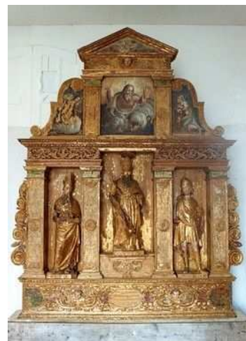
L'altare in fase di restauro negli anni ottanta

L'altare, con la mensa in pietra ardesia, ora è collocato in mezzo al presbiterio, ma prima del restauro stava addossato alla parete di fondo, coprendola quasi per intero con la sovrastante mole della pala lignea ; questa, nella zona posta al centro, è sezionata in scomparti che fungono da nicchia per le tre statue dei titolari, mentre in alto, dipinto su tavola, occhieggia un Padreterno circondato dalla scena dell' Annunciazione. Almeno gran parte del complesso appartiene all'altare della consacrazione della chiesa, che è registrata (passi la ripetizione) alla metà del sec. XVI ; ciò vien suffragato anche dal Bergamini (18), il quale lo giudica databile verso il 1570 per la « sua struttura