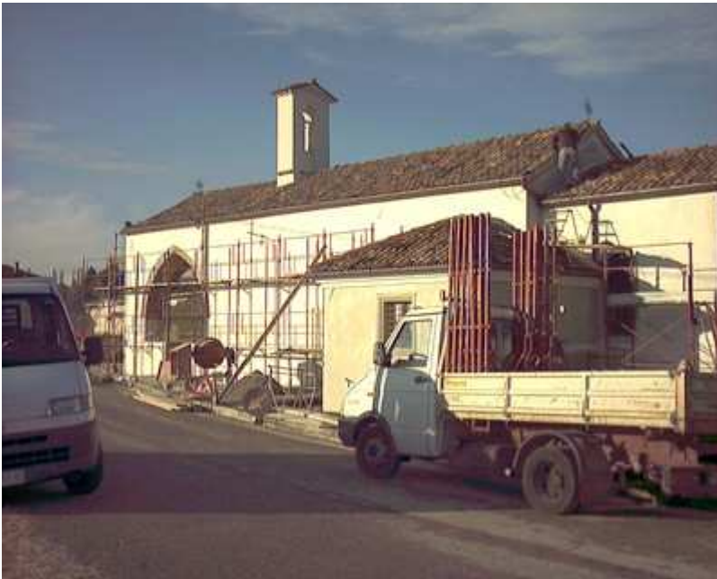
Una fase dei lavori di restauro.

I lavori di restauro presero a concretarsi a metà maggio 1978. Le opere del consolidamento statico proseguirono sulle seguenti direttrici: risanamento murario, ripristino dell'interno, misure conservative, adeguamento liturgico e sistema di illuminazione. Per l'effettuazione di tale piano s'incominciò con uno scavo al perimetro esterno della chiesa per eseguire sottomurazioni alle fondazioni e formare un vespaio su cui porre un marciapiede allo scopo di scolare le acque meteoriche preservando così la base della costruzione dall'attacco diretto dell'umidità, data l'originaria assenza di grondaie. Il marciapiede, per un ritorno ai gusti dei padri che vi posero un ciottolato aderente al muro e ritrovato a 30 cm. sotto il livello di campagna, è costituito dal classico «pedr&agravet» con la sola innovazione dello strato emergente che non è un letto di sabbia o di ghiaia, ma di malta in cemento. Per il risanamento delle pareti si passò alla spicconatura degli intonaci esterni ed interni per sostituirli con stabilizzatura in calcestruzzo e così impedire le dannose infiltrazioni d'acqua. Su questo piano, due i