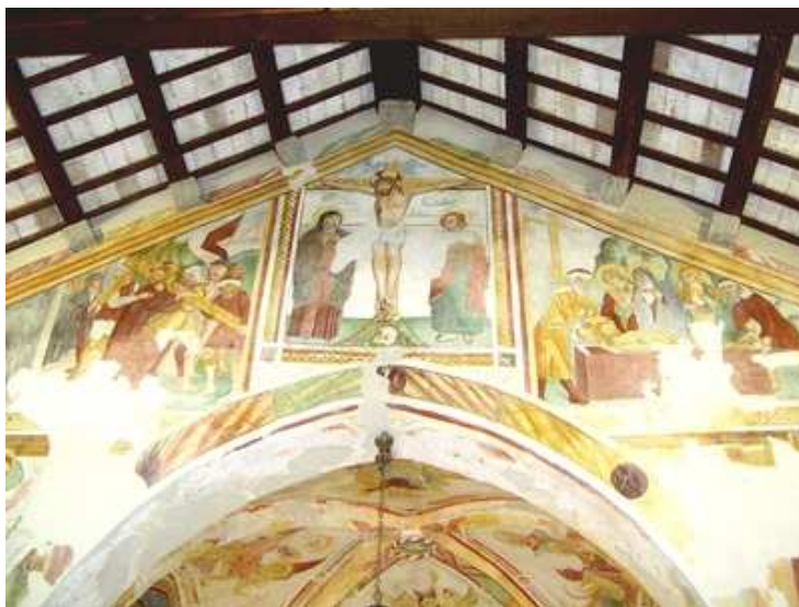
La parte superiore dell'arco trionfale