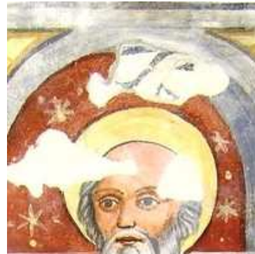
Tracce dell'antico affresco sulla parete di fondo.