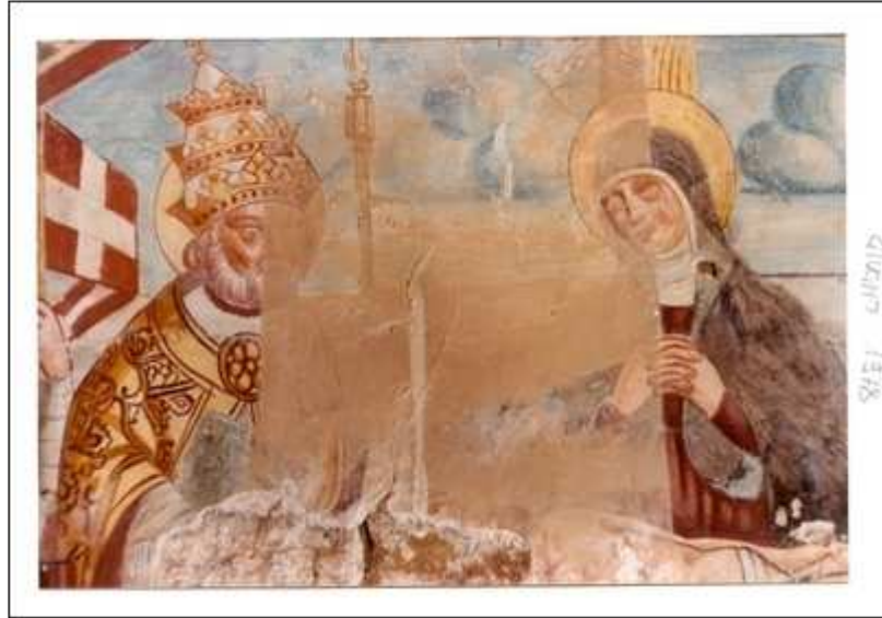
Affresco in fase di pulitura