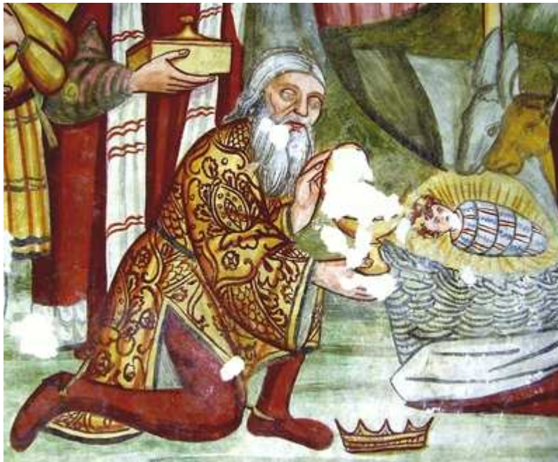
Uno dei tre Re Magi con Gesù Bambino.

affreschi presente a Laipacco, avanza l'idea che siano da ascrivere alla scuola del Thanner più che al suo pennello. Altri esperti escludono che il Thanner abbia potuto avere una scuola, sia per la modesta levatura artistica, sia per la scarsa disponibilità di mezzi economici; forse avrà avuto una bottega artigianale con un garzone o un imbianchino, che nei nostri paesi può essere chiamato «pittore», ma non di più. Anche se in S. Pelagio non venne in luce, com'è chiaro a Laipacco, il segno della firma del Thanner, la maniera sia pittorica che grafica dovrebbe venire attribuita alla stessa mano con quelle variazioni che l'intervallo di una decina d'anni, esistente fra le due realizzazioni, comporta.