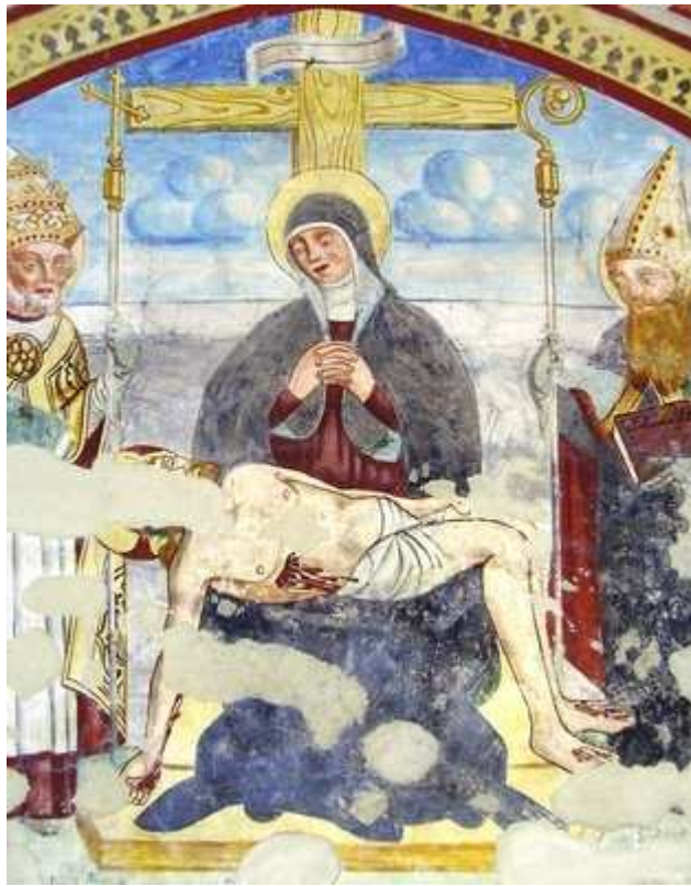
Dettaglio della “Pietà” con i santi Pelagio e Agostino.