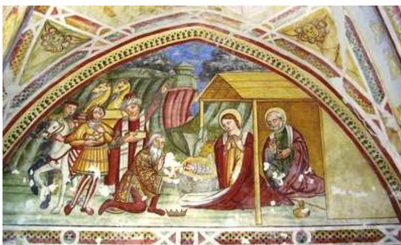
Adorazione dei magi.