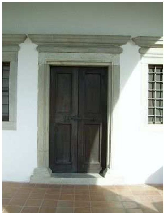
La porta di ingresso alla chiesetta

Dalla navata si accede alla piccola sacrestia , pure quadrata, posta a destra; qui c'è da rilevare: metri 3,50 di lato, soffitto a volta, due finestrelle (a levante e a mezzodì), un lavabo sagomato in marmo di buona fattura ed incastrato nel muro verso il presbiterio ed una piccola nicchia sita nel muro est.