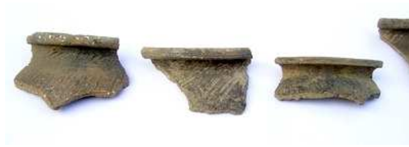
Frammenti di vasi lavorati al tornio.