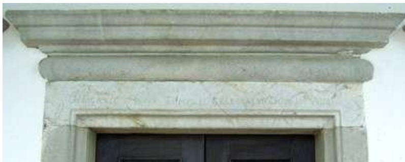
L'iscrizione scolpita sull'architrave della porta di ingresso.

Alla fiesta del titolare S. Pelagio , che da secoli veniva celebrata il 28 agosto e che da tempo è ormai in disuso, risulta che partecipava il pievano con tutti i sacerdoti di Tricesimo per cantare «lo santo sacrificio della Messa et altri sacrificii» . Ma la festa «grande», la sagra della chiesa e della località, liturgicamente chiamata «dedicazione» resta segnata in perpetuo sull' architrave in pietra della porta d'ingresso con questi termini: «Dedicatio Huius Templi Celebratur Dom. in Albis» , cioè nell'ottava di Pasqua.