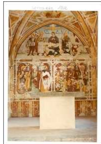
Dopo il restauro